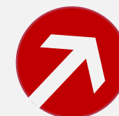
Evolution Prix Gaz pour un contrat de 3 ans depuis 2016