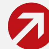
Evolution Prix électricité par année de livraison depuis 2018