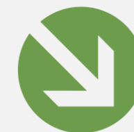
Evolution Prix électricité par année de livraison depuis 2018